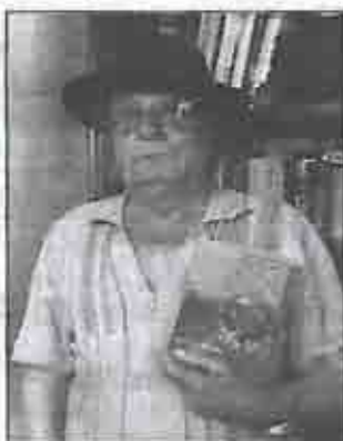
AUTEUR. A 77 ans, le Bourbonnais publie son premier livre, un vrai rêve de gamin.

essayé à la musique et a sorti une cassette audio de chansons tziganes. La même année, il avait tenté